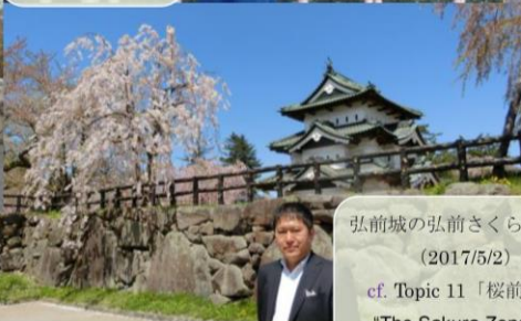
弘前城の弘前さくらまつり (2017/5/2) cf. Topic 11 「桜前線」 "The Sakura Zensen"