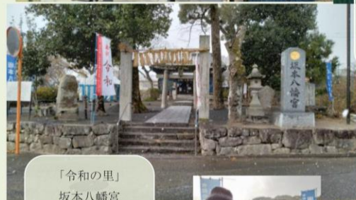
「令和の里」 坂本八幡宮 (2023/12/21) cf. Topic 15 「元号」 "Gengo"