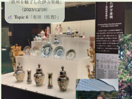
九州国立博物館 「欧州を魅了した伊万里焼」 (2023/12/19) cf. Topic 6 「有田 (佐賀)」